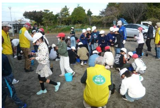
（清原東小学校の出前授業）

☆本年の作開始は3月7日（土）9時からです。多くの方の参加をお待ちしています。 「気楽に楽しく♪」自然に触れましょう!! （植月）